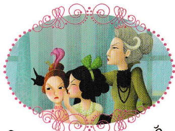
Surorile și mama vitregă