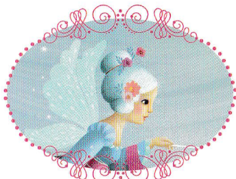
Zâna cea bună